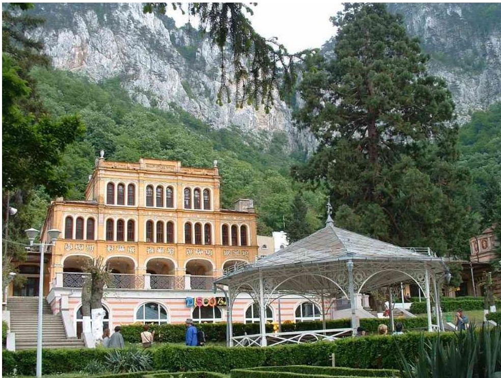
Kaszinóépület és mamutfenyő Herkulesfürdön