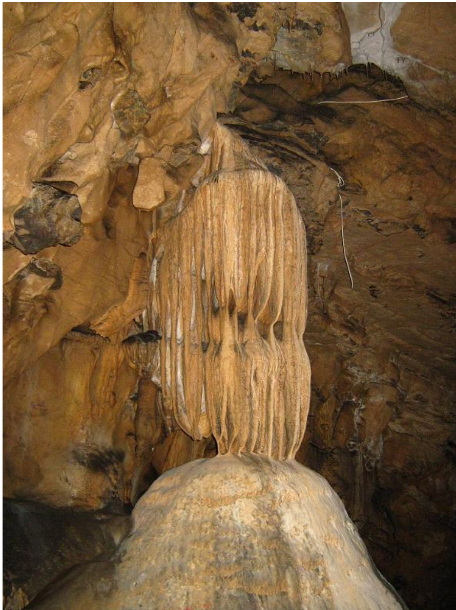
Banánfürtök a Komárnik csepkőbarlangban

Az alsó kővájatban a Ponikova patak fut keresztül, mely az évezredekken át kialakult csepkőbarlang formálásának legfőbb tényezője. A felső, járható folyósó számos kisebb-nagyobb termet fűz egymásba (Zebrák terme, Agyagterem, Múzeum, Kristályterem, stb.), melyeknek mindegyike látványos sztalagmitikus képződményeket rejteget. Ezen alakzatok – ahogyan az a csepkőbarlangok esetében megszokott – hasonlóságon alapuló, legtöbbször tréfás elnevezésekkel bírnak. Ezek közül egyesek korszakonként és a barlangkutatók fantáziájának függvényében változnak. Manapság ilyenekkel találkozhatunk: Kókuszdió, Meduza (újabban Hamburger), Anyósnyelv, Kis- és Nagyorgona, Szénakazal (Kólásüveg), Betyárok asztala, Cápaszáj, Banánfürt, Szerencsekút, Kínai falak, Hófehérke és a hét törpe, stb.).