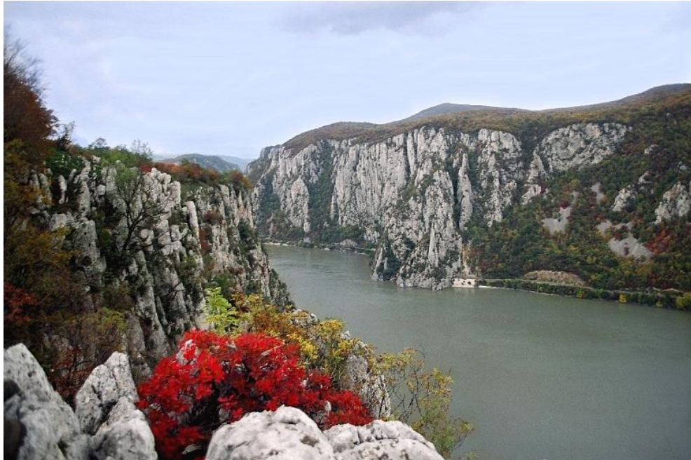
A Kis-Kazán

A karsztikus jelleg lépten-nyomon fellelhető, hol erőteljesen uralva a felszínt, mint a Kis-Kazán esetében, hol rejtetten – például zombolyok alakjában – főleg a Nagy-Kazán környékén. A föld mélye pedig barlangokat rejteget, melyekből eddig hetet azonosítottak. Közülük a leghíresebb a Ponikova barlang, melynek bejárata közelében az azonos nevű patak egy rövid és vad szurdokvölgyet valamint egy természetes 6 – 8 méter magas és 25 méter hosszú természetes hidat kreált a sziklába az idők során. Maga a barlang 1.666 méter hosszú és miután átfúrja magát a Nagy Sukár (Ciucanul Mare) hegy alatt, nyugalmat a Duna medrében lel magának.