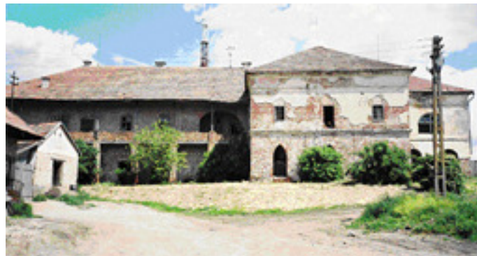
“The Mercy Castle”

Ezután az országút amelyen idáig is jöttünk, fordul egyet jobbra majd hirtelen még egyet balra, szemmel láthatóan “letér” a történelmi nyomvonalról, hogy a jelen követelményeinek megfelelően Mercyfalva (Carani, Mercydorf) felé vezessen bennünket. Nevét – útvonalunk következő állomása – Florimund Mercy tábornoktól örökölte, a török idők utáni Bánság kormányzójától, aki annak idején vonalzóval húzta meg Temesvár (mostani belvárosa) utcáinak nyomvonalát. Persze ezt nem a huszadik század építészeinek kedvéért tette, hanem hadászati megfontolásból: könnyebben lehetett így kartácstűz alá venni a városba esetleg betörő ellenséget.