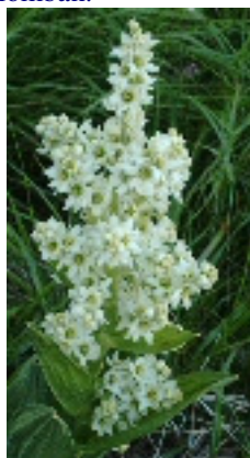
Virágvarázs