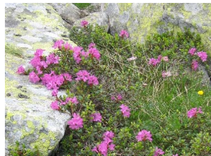
Így is lehet élni

Még nagyszámban virított a hóvirág, de már kivirágzott az ibolya, a salátaboglárka, a berki szellőrózsa, a pettyegtetett levelű tüdőfű valamint a pittypang (gyermekláncfű).