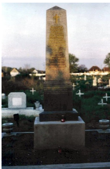
Az emlékkövet készítette Tunner Lajos temesvári kőfaragó.

A leleplezés 1897 június 8-án, pünkösöd hétfőjén történt, „fényes ünnepség keretében” (Délmagyarországi Közlöny / 1897 június 9), amelyen részt vettek a gyertyámosiak mellett nagykikindai, billédi, bobdai, temesvári és kisjécsai vendégek is, és természetesen az ott nyugvók szülőfalujának Tamásfalva és Aurélháza képviselői is, valamint az elesettek hozzátartozói, bajtársaik.