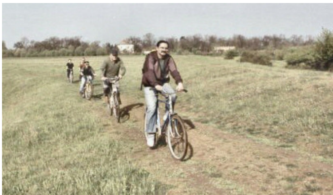
Amikor, csak úgy jókedvünkől is, nyeregbe kapunk

Így jutottunk el Kalácsafüldőre, ahol kiderült, hogy ez az oázis nemcsak a kezelésre szorultak számára nyújthat kellemes perceket, hanem azoknak is, akik őzikét akarnak etetni tenyerükből, sétálni szeretnek egy rendezett parkban, vagy éppen akkora energia szorult beléjük, hogy ráadásként még futballoznának egyet. Végül meg sem érzett 15 kilométer gyaloglás és sok-sok ugrabugrálás után, este negyed kilenckor szálltunk vonatra Temesvár felé.