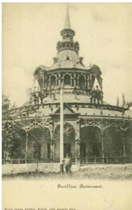
A Buziásfürdő-i üdülőpark vendéglő-pavilonja a huszadik század elején

Temes megye természetvédelmi területei a következők: