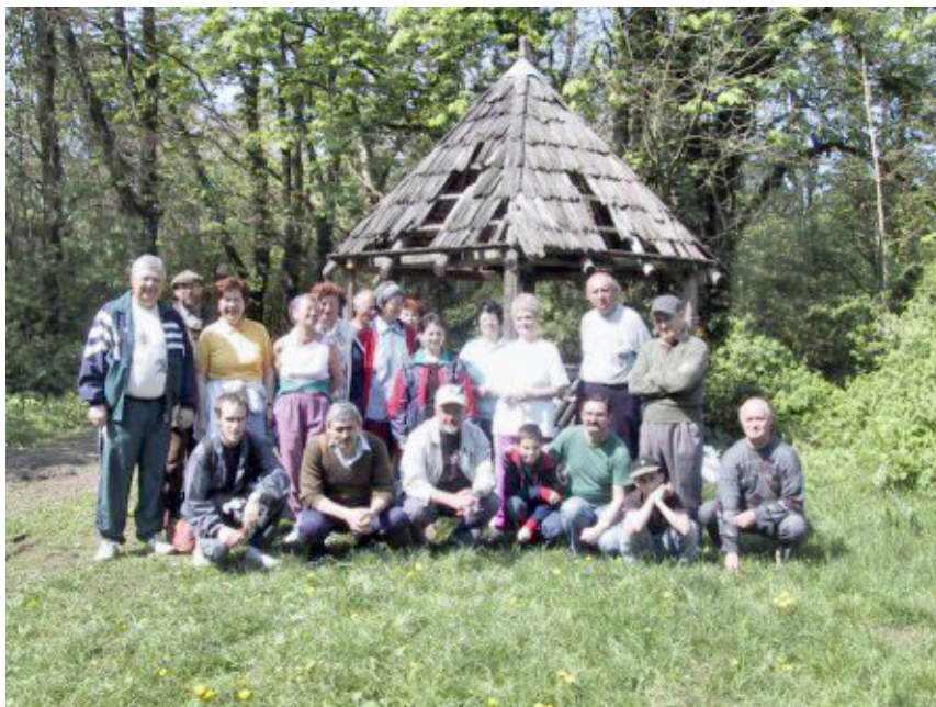
Temesvári ekések a számukra kedves, sűrűn látogatott Újbázos-i arborétum központi tisztásán – 2002 tavaszán