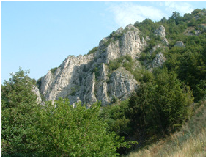
Szászka felől, így kezdődik a Néra szurdokvölgye