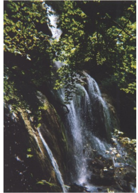
A Beusnica első, egyben legismertebb vízesése

A második tájegység merőben elüt az előbbiektől. Ez a Nérától északra fekvő, alig 100 hektárnyi terület a Beu patakot életet adó „Ochiul Beului” krátertavat, a Beusnica patak mésztufa lépcsőit és vízeséseit, valamint egy, délszaki vadorgonának, ecetfának, törökmogyorónak menedékkül szolgáló térséget foglalja magába. A körzet egy körülbelül 5 km-es bekötőúton egészen