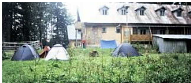
EKE sátoztábor a menedékház mellett, 2002 júliusában

favágóházat látunk. Újabb öt perc múlva egy hideg forráshoz érünk, bővízü és látványos, ahogyan egy mészkőszikla alól felbukkan. A jó úton vagyunk !