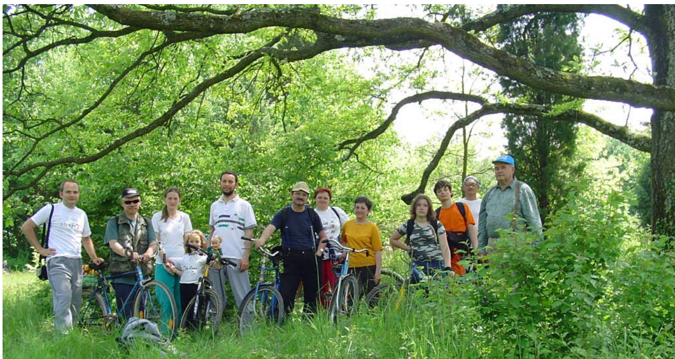
Bringásaink az Újbázos-i arborétum fáinak árnyékában