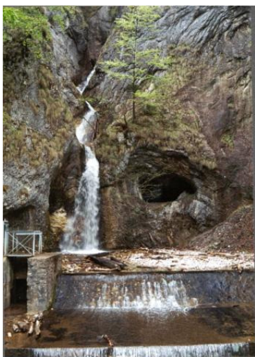
A Schmidl vízesés

Az "aszfaltos" útvonal a következő: Arad – Pankota – Borosjenő (Ineu) – Halmágycsúcs (Vârfurile) – Vaskohsziklás (Ștei) – Szedres (Sudrigiu) – Vasaskőfalva (Pietrosa). Aradtól Halmágycsúcsig a 79A jelzésű országos főúton megyünk, majd rátérünk a Nagyvárad–Déva közötti 76-os nemzetközi főútra. Szedres községig 155 km hosszú az út. Innen még 12 km-t kell megtennünk (szintén aszfalton) Vasaskőfalváig. Honctő (Gurahont) helységtől igen szép tájakon vezet utunk, lombhullató erdők és napsütötte tisztások váltakoznak, kellemesen hatnak a síksághoz szokott szemünknek. Néha előtűnik jobbra, kelet felé a táj felett örökdő fenséges Nagy-Bihar (Curcubăta Mare ) 1849 m-es csúcsa, rajta a tévétoronnyal.