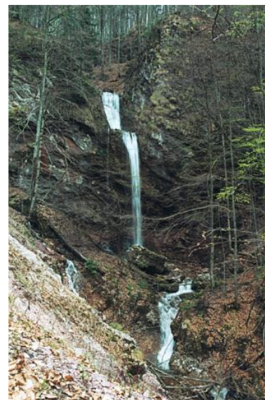
A Gáspár és Menyhárt esések

Miután kipihentük az autótúrá fátalalmait, esetleg falatoztunk is egyet, nekiveselkedtünk a Boga körút vízeséseit megtekinteni. Mivel Czárán útjai elpusztultak, izgalmas, felfedező jellegű túrára van kilátásunk.